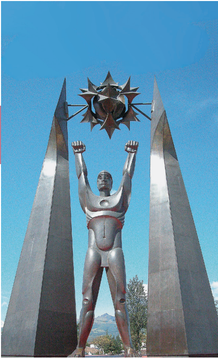
Monument bij Sangolquí van de Incageneraal Ruminahui, die Quito liever in as voor de Spanjaarden achterliet dan dat hij zich overgaf.