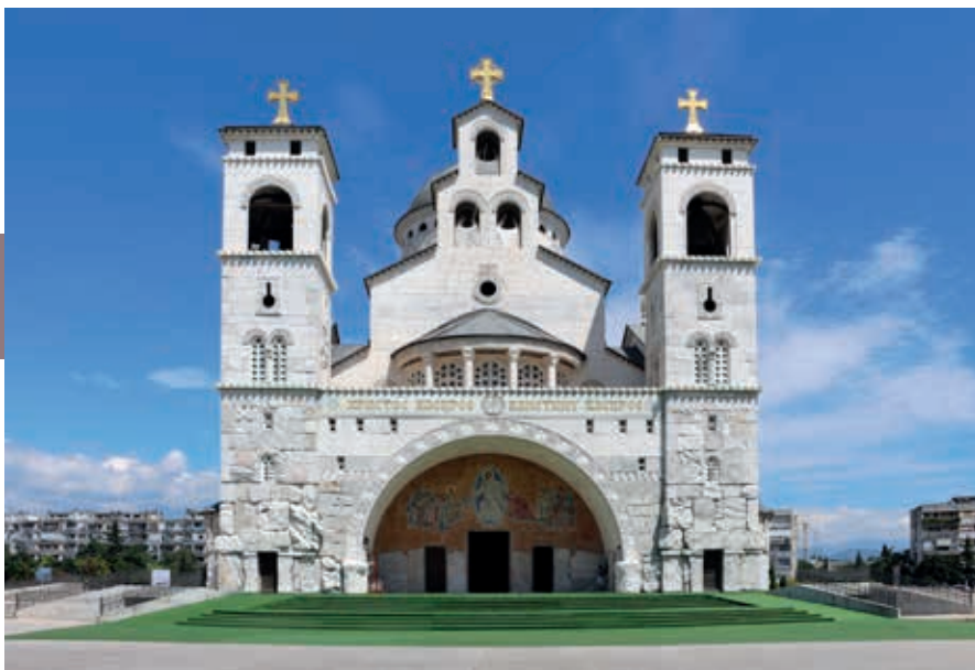
De kathedraal van Podgorica werd in 2013 geopend.

architect Ben van Berkel, en de bruggen van de Spaanse architect Calatrava. De Millenniumbrug in Podgorica werd in 2005 geopend en is sindsdien een van de belangrijkste herkenningspunten in de skyline van de hoofdstad. In het zuidelijke deel van Novi Grad ligt het grote Park Petrovića. Aan de rand staat de Amerikaanse ambassade, het zalmroze Dvorac Petrovića (Petrović-kasteel) in het park was vroeger een kasteelcomplex van koning Nikola I. In de jaren 80 werden het kasteel, de kasteelkapel en de gebouwen erbij omgevormd tot kunstgalerie, die sinds 1995 onder beheer staat van het Centrum voor Moderne Kunst (Centar savremenih umjetnosti Crne Gore). De collectie bestaat uit ongeveer 1500 kunstwerken, vooral van kunstenaars uit het voormalige Joegoslavië. Je kunt op de bovenverdieping ook een vreemde verzameling objecten bekijken uit landen die tot de Beweging van Niet-Gebonden Landen behoorden. Dit waren landen die noch tot het Oostblok noch tot de westerse landen behoorden; Joegoslavië was een belangrijke voortrekker van de beweging, Tito zelf was van 1961 tot 1964 voorzitter van de club.