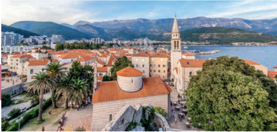
Budva, uitzicht over de oude stad.