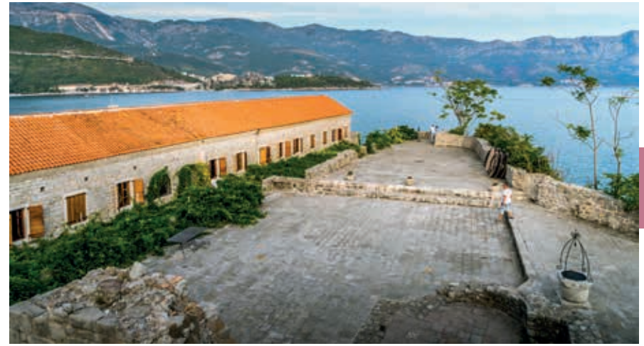
Op de citadel van Budva.

Achter de hoofdboort in de Venetiaanse vestingmuren loopt de belangrijkste straat van Stari Grad, de Njegoševa . Verwacht geen brede winkelstraat of verkeersader, want de oude stad is autovrij en bestaat louter uit smalle en schilderachtige straatjes met hier en daar een pittoresk pleintje, allemaal piekfijn gerestaureerd na de aardbeving van meer dan 45 jaar geleden. Er