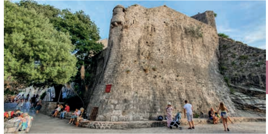
De stevige stadsmuren van Budva hielden ongewenste bezoekers buiten de deur.

staan. Vervolgens liep de historie parallel met die van de rest van Montenegro: onderdeel van het Joegoslavische koninkrijk, bezetting door de Asmogendheden in de Tweede Wereldoorlog en daarna deel van het naoorlogse Joegoslavië, tot aan de Montenegrijse onafhankelijkheid in 2006.