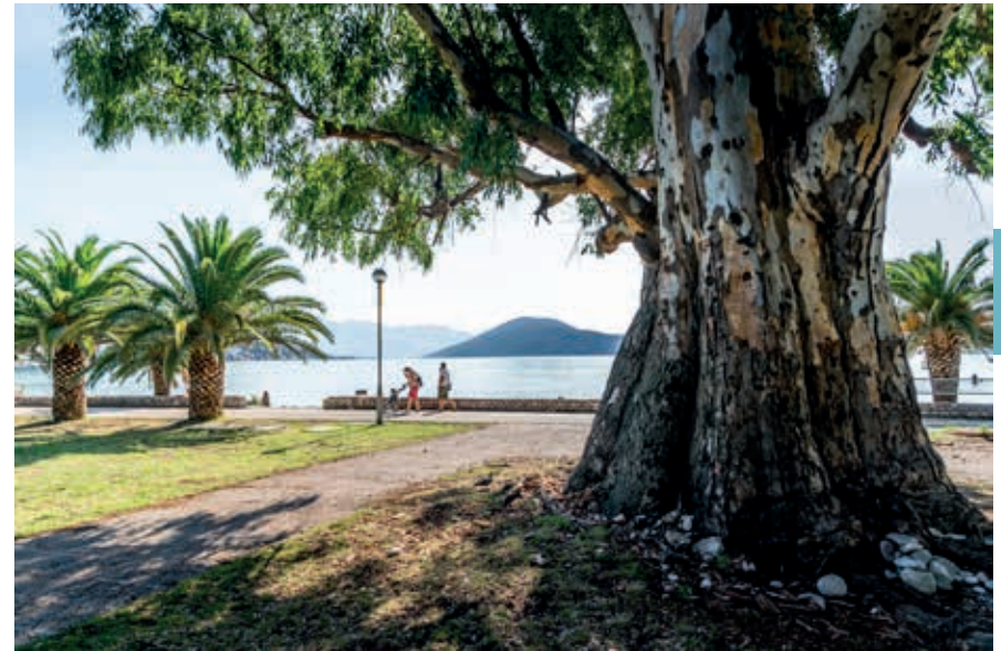
Langs de baai bij Igalo.

Nu kun je vanuit Kroatië gewoon over de Magistrala Montenegro binnenrijden. De eerste plaats van betekenis voorbij de grens is Igalo , gelegen aan het einde van de baai van Herceg Novi (Hercegnovski zalev). Als je er aankomt kan het reusachtige Institut Igalo ook wel Spa Centar Igalo, rechts van de weg, je niet ontgaan. In het vroegere Joegoslavië hadden de therapeutische en geneeskrachtige behandelingen in dit kuuroord een naam hoog te houden. Het complex is sinds die tijden nauwelijks opgeknapt en ziet er nog steeds strak-socialistisch uit. De kamers kunnen wel wat modernisering gebruiken, maar de medische behandelingen zijn er nog steeds erg goed, bijvoorbeeld met de befaamde geneeskrachtige modder uit de baai ('Igaljsko blato') en het minerale bronwater uit de heuvels ('Igaljske slatine'). Er komen daarom ook redelijk wat mensen uit Nederland en België voor een kortere of langere kuur naar Igalo.