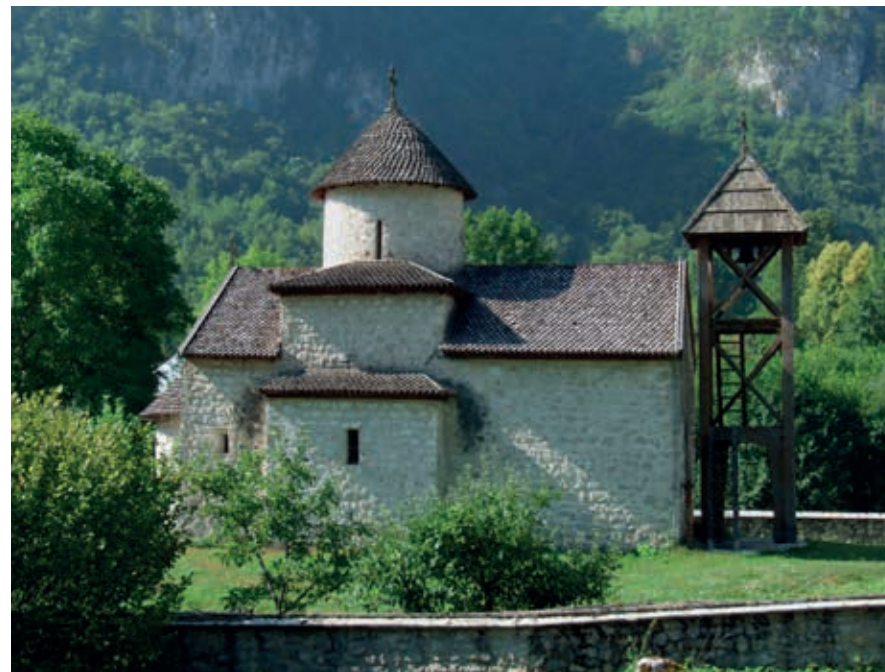
Het Klooster van Dobrilovina.

Een paar kilometer na Bistrica komt de weg door de kloof langs het gehucht Gornja Dobrilovina. Een bordje wijst hier op een zijweggetje richting rivier, dat na een paar minuten uitkomt bij het orthodoxe Klooster van Dobrilovina . In 1592 stonden de Osmaanse heersers de lokale bevolking