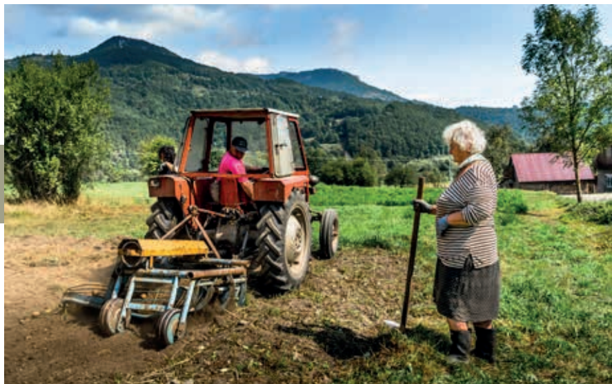
In het noordelijke binnenland leeft men vooral van kleinschalige landbouw.

Het eerste deel van de route na Mojkovac is de vallei nog vrij breed, maar allengs wordt het smaller en rijzen de bergwanden aan weerszijden steeds hoger op. Behoorlijk diep beneden de weg zoekt het rivierwater bruisend en kolkend zijn weg tussen de stenen en over de rotsen. Verschillende bedrijfjes verzorgen raftingtochten op het onstuimige water, bijvoorbeeld vanuit Kolašin, Mojkovac of Žabljak. Zulke tochten behoren zonder twijfel tot de leukste activiteiten die je in Montenegro kunt ondernemen.